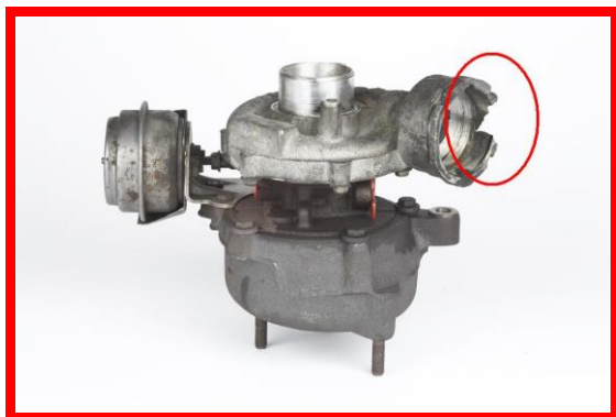
Figura 5 – Carcasa rupta