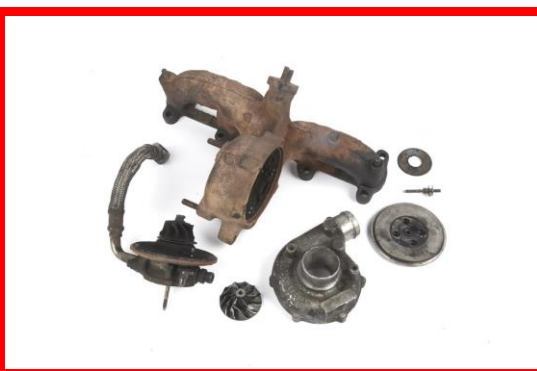
Figura 2 – Turbosuflyanta dezasamblata