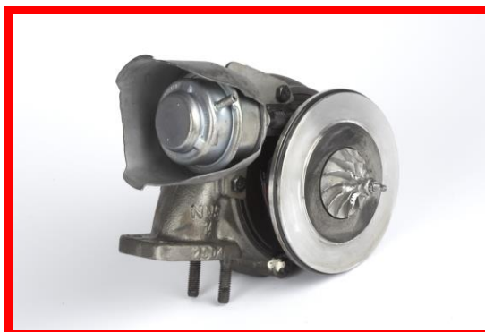
Figura 1 – Turbosuflyanta incompleta